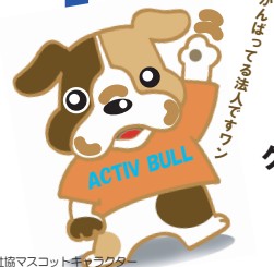
東社協マスコットキャラクター